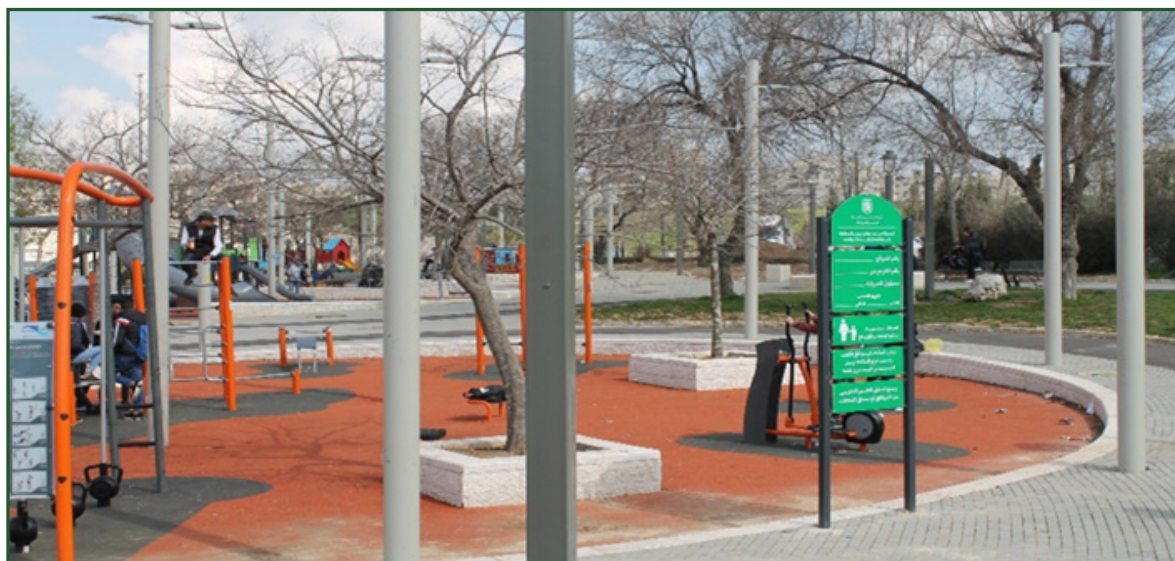
תמונה 2: גינת משחקים משופצת בסמוך למרכז רוקפלר, רחוב סולטאן סלימאן

את התושבים (ועדי הורים, מרכזי דת, התאגדויות עסקיות וכו'). ועדות קהילתיות אלה יכולות לספק לתושבים קול אל מול גופי העירייה והתכנון בנושאים שונים וביניהם פיתוח ובינוי של מבני ציבור ופארקים.