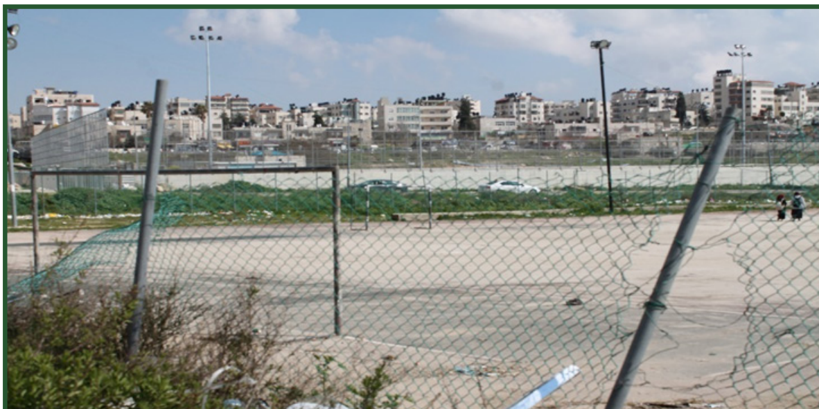
תמונה 3: מגרש משחקים עירוני, בית חנינא