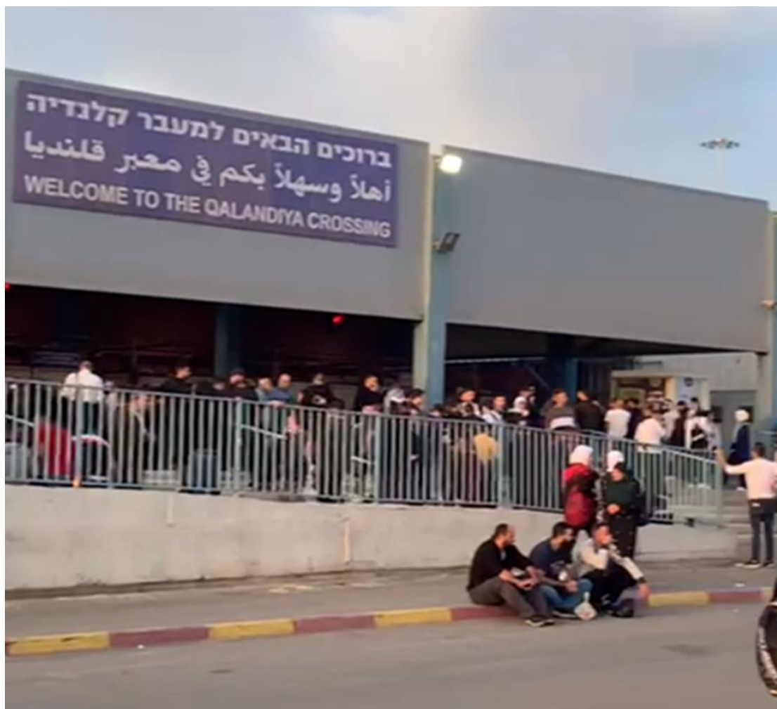
צפיפות במעבר הולכי הרגל במחסום, בהמתנה לבידוק 29.10.2023

מרגישים שהם בכלא, בלי שהם עשו שום דבר רע. רק כי הם פלסטינים. אבל אנחנו תושבי קבע, ירושלים היא העיר שלנו, אין שום קשר בינינו לבין המלחמה. כמו כולם, אנחנו רוצים לחיות את החיים שלנו בשקט. לעבוד, להתפרנס, לחיות חיים נורמליים. המצב מאוד קשה".