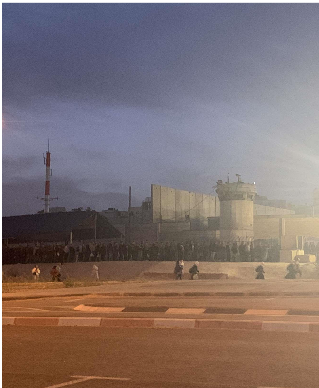
תור לכניסה למעבר הולכי הרגל בטרמינל, שש בבוקר, 24.10.2023