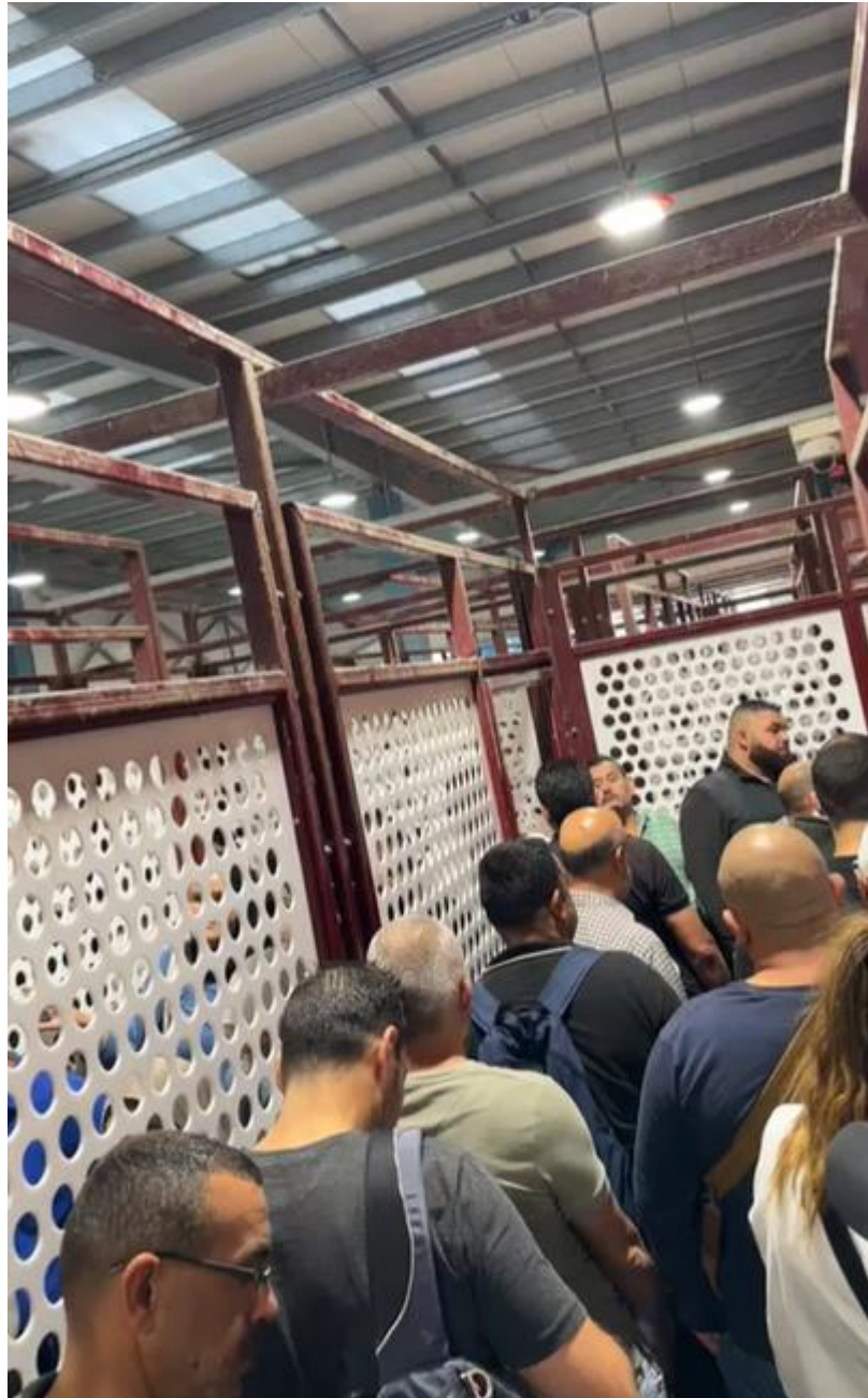
כניסת הפועלים והתלמידים לעמדת הבידוק בטרמינל, 24.10.2023