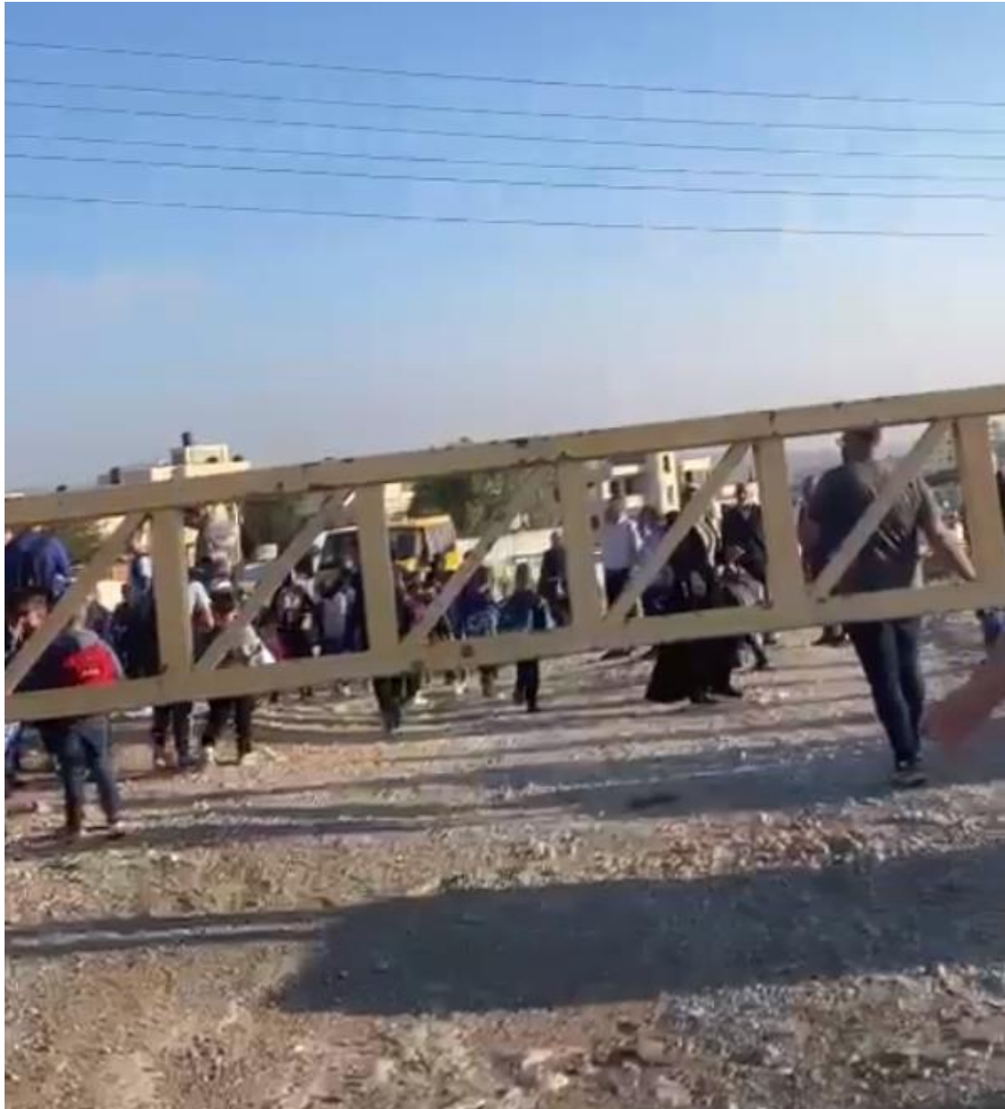
השער הסוגר את הכביש למסלול חיזמה, נפתח ונסגר ללא התראה, 26.10.2023