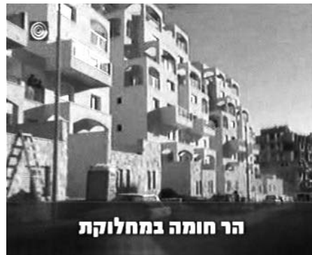
הר חומה במחלוקת

סיקור יוצא דופן: דיווח בולט על המחלוקת בהר חומה. ערוץ 1, מכותרות מהדורת החדשות של ה-12 בדצמבר.