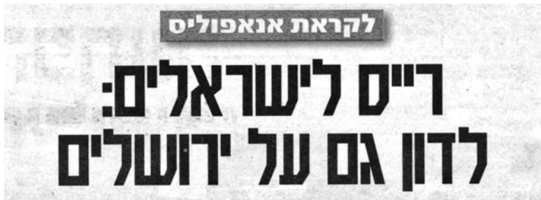
"ידיעות אחרונות", 15 באוקטובר, כותרת בעמוד 2

רייס לישראלים: לדון גם על ירושלים ("ידיעות אחרונות", 15 באוקטובר, עמוד 2, כותרת ראשית).