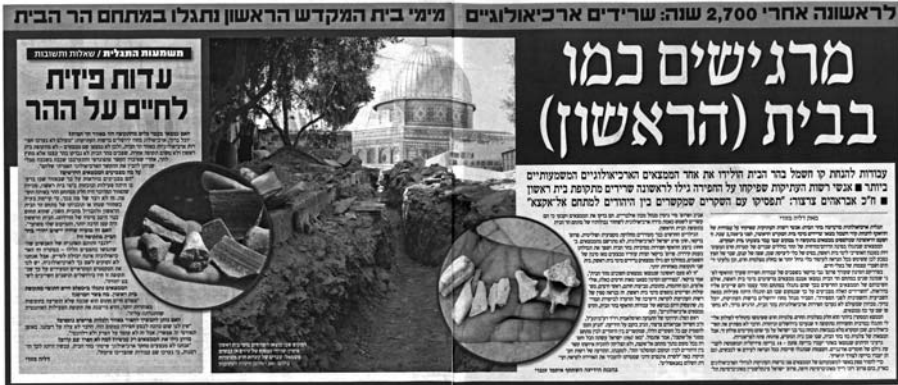
"מערב", כותרת המתפרסת על כפולת עמודים 8-9, 22 באוקטובר

חשוב להדגיש כי משמעות הצנעת העיסוק בחפירות פירושה הצנעתם של פרטי מידע אחרים, הנושאים אופי פוליטי ועל כן רלוונטיים מאוד לקיומו של שיח ציבורי. כך למשל, בעקבות שוליותו של הנושא מוצנעת העובדה כי עמותת אלע"ד 4 שמטרתה ייחוד מזרח ירושלים, היא שותפה מרכזית במימון החפירות בעיר העתיקה ובניהולן. המידע החשוב הזה מופיע אמנם בכתבתו של נדב שרגאי שפורסמה ב"הארץ" ב-6 בדצמבר, אך הוא מופיע כבדרך אגב בלבד, בתוך הקשר מקצועי המדווח על הממצאים: