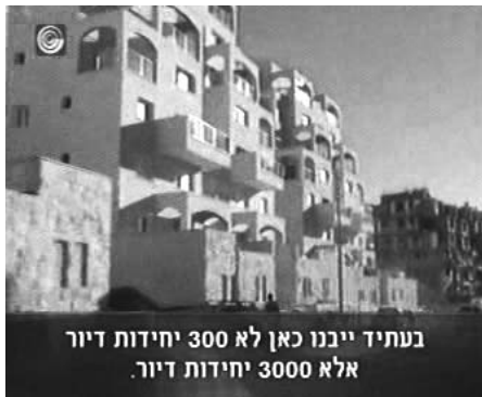
בעתיד ייבנו כאן לא 300 יחידות דיור אלא 3000 יחידות דיור.

הר חומה שכונה בדרום ירושלים שלא מפסיקים לבנותה ולהרחיבה [...] המטרה יצירת חיץ בין בית לחם לרמאללה. המכרז ל-307 דירות הקפיץ את האמריקנים, הירדנים, המצרים, שלום עכשיו, הפלסטינים. ובאותה שעה ממש שבה ישבו המשלחות הישראלית והפלסטינית למשא ומתן, והפלסטינים דרשו ביטול המכרז, הגיע אביגדור ליברמן, עם סיעתו, לסיור. [ליברמן:] "הר חומה מבטא את הקונצנזוס המקסימאלי במפה הפוליטית ישראלית". ליס: מתברר כי המכרז ל-307 יחידות הדיור הוא לסיוע שלב ב'. לשלב הבא מתוכננות עוד כמה אלפי יחידות דיור, מקצתן כבר אושרו [...] מחאת האמריקנים והפלסטינים נדחית בידי שר השיכון, זאב בוים. הוא הצהיר: "הבנייה בהר חומה חוקית והיא תימשך בלי כל הפרעה".