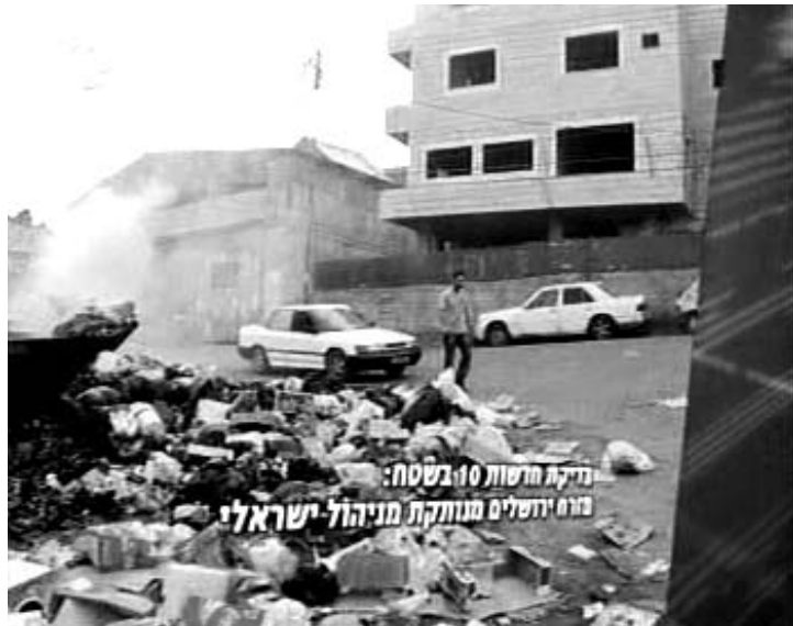
סיקור יוצא דופן: ביקורת על אפליית תושבי ירושלים הפלסטינים מגיעה לכותרות. ערוץ 10, מכתרות המהדורה, 8 באוקטובר

בכתבה עצמה מתאר זוהר כיצד עיריית ירושלים "התנתקה חד צדדית" מעשר שכונות במזרח ירושלים שקרוב ל-60,000 תושביהן הם, כדבריו של זוהר "מזרח ירושלמים לכל דבר".