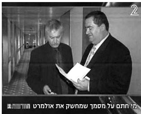
ערוץ 2, כותרת בפתיח המהדורה, 18 באוקטובר

מי חתם על המסמך שמחשק את אולמרט בעניין ירושלים? חבריו מקדימה (ערוץ 2, 18 באוקטובר, מכתרות המהדורה).