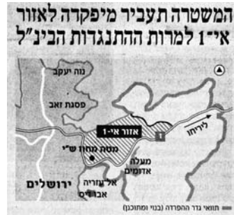
תרשים איזור אי-1. "הארץ", 1 באוקטובר, עמוד ראשון.

עיתון "הארץ" בלט בסיקור נושא הרחבת ההתנחלויות באיזור אי-1, בכמות הדיווחים ובבולטותם. סיקור כזה יכול להבהיר את המחלוקת בנושא זה.